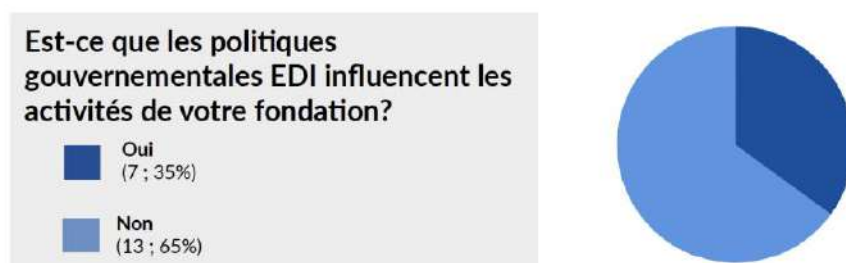
Figure 5 : Résultats de l'enquête menée en parallèle des entretiens

Ce rejet des définitions de l'État est moins une remise en cause des principes de l'EDI qu'une critique de leur application, perçue comme rigide dans des politiques publiques déconnectées