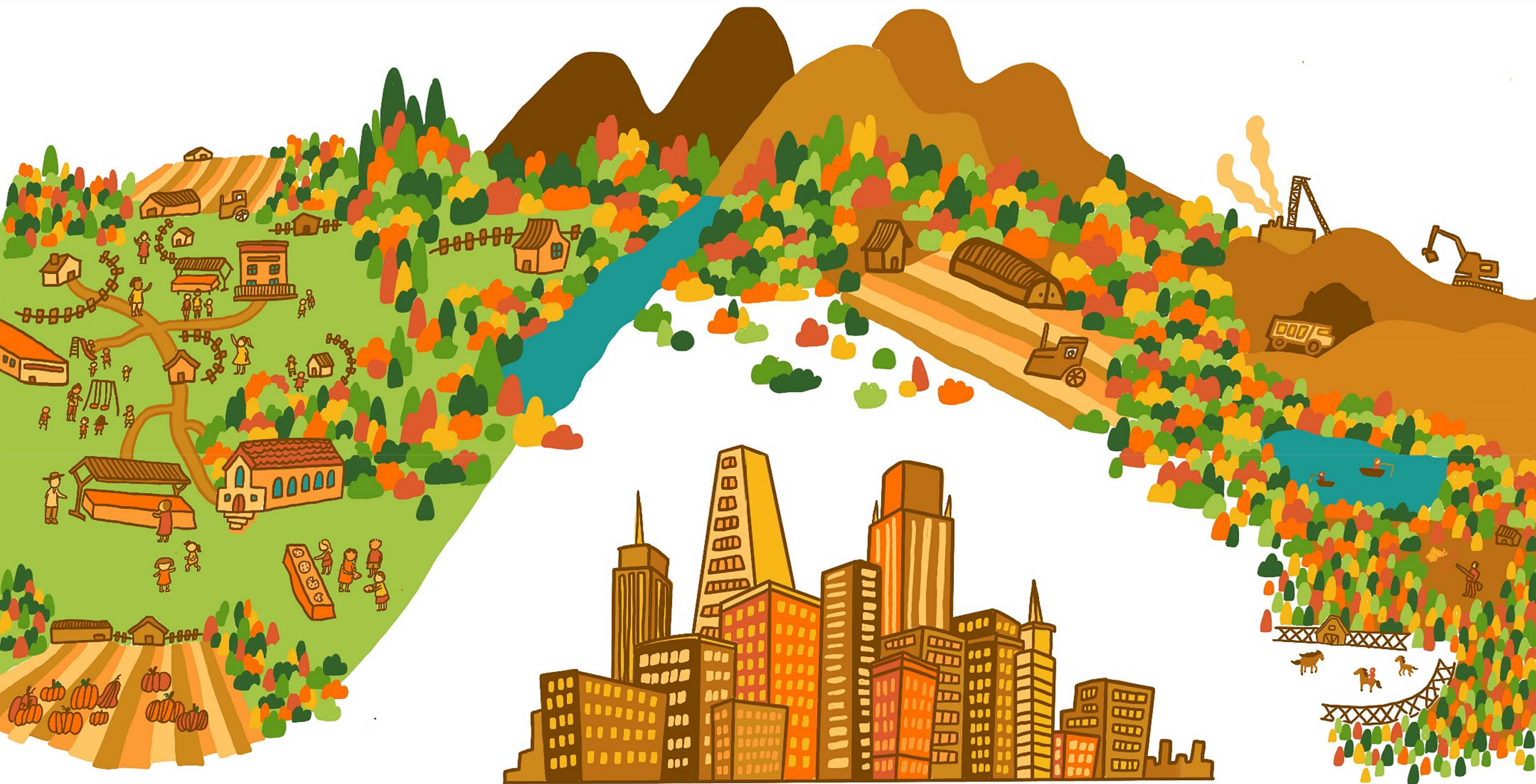
Illustration par Mandy Wu