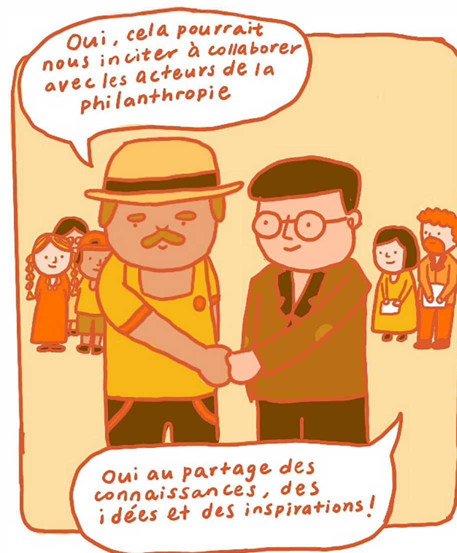
Illustration par Mandy Wu