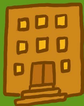
Illustration par Mandy Wu

investissements sous l'angle de la RSE/RSO et des ODD