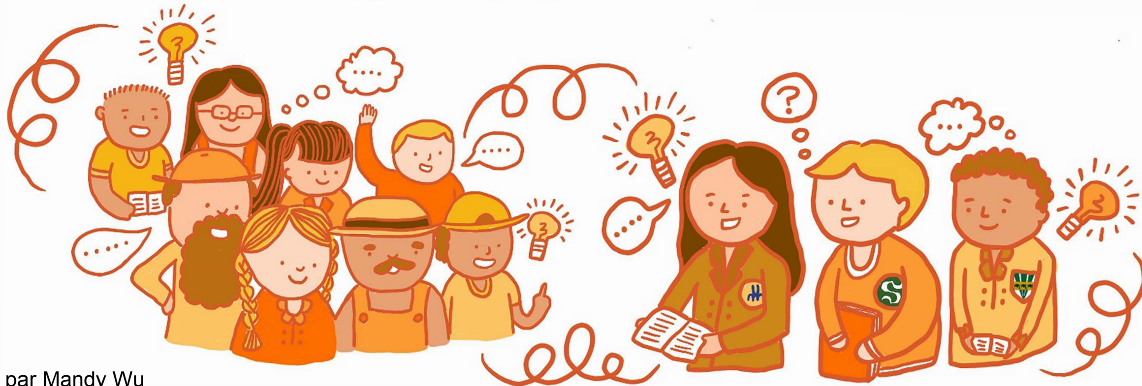
Illustration par Mandy Wu