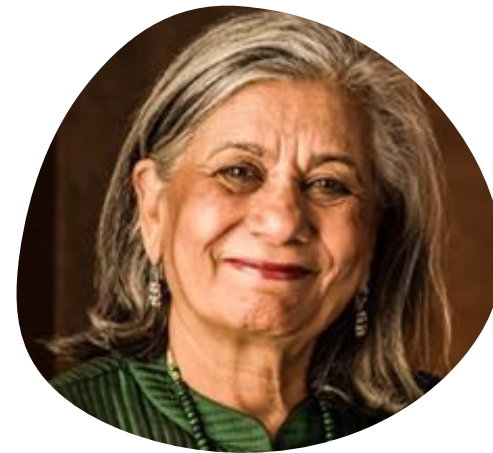
L'Honorable Sénatrice Ratna Omidvar